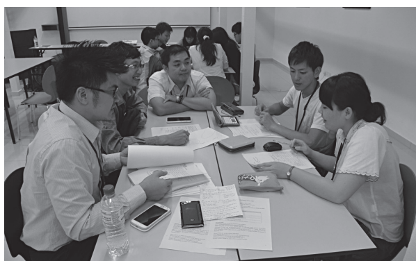
本学ペナン校で環境問題について議論する 本学とマレーシア科学大学の学生たち（第2期）