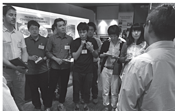
Mini-circuit 社を訪問し、日系企業 との違いを実感した本学学生（第3期）