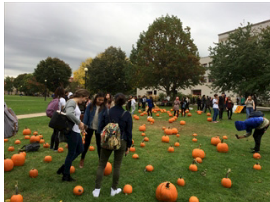
A lot of pumpkins on QC campus

Donut shop, very uncanny color donuts are sold for Halloween version. Of course, there are a lot of Halloween decorations in the Summit and the QC campus as well. The QC campus is full of pumpkins. In the Summit, many events for decorating and drawing pictures of Halloween were held, and I feel that it is a very cheerful atmosphere.