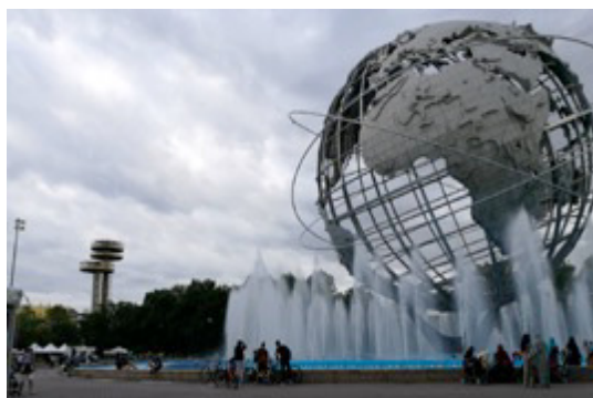
Photo: Flushing Meadow Corona Park

After the arrival in Queens College, I realized Queens often appears in films. For example, Men in Black (1997) is famous one of them. As shown in the photo below, Flushing Meadow Corona Park might remind you the scene of a UFO crashed in the middle of the park. Another one is "Spider Man: Homecoming". Watching the film, some scenes reminded me the downtown in Queens Borough.