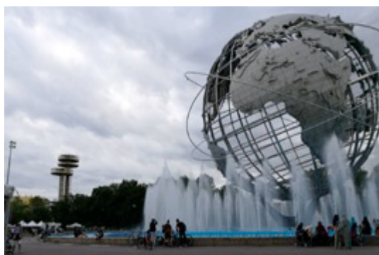
写真;フラッシング・メドウ・コロナパーク

QCについてから気がついたのですが、クイーンズを舞台にした映画がけっこうあるんです。有名などころでは「メン・イン・ブラック(1997)」があります。写真に示しましたが、フラッシング・メドウ・コロナパークは、映画のなかでUFOが墜落してくるシーンで憶えている方もいるかもしれませんね。