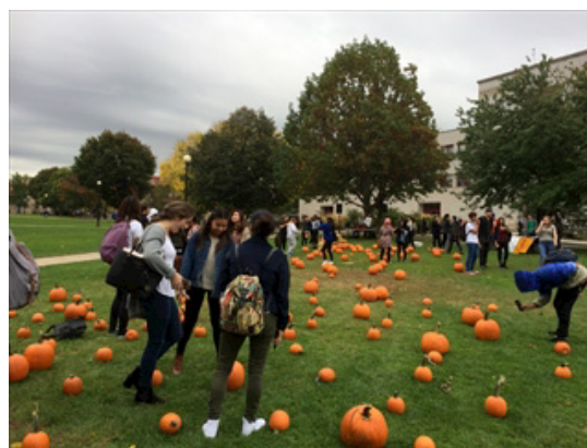
キャンパス内に溢れるカボチャ

インの飾り付けがいっぱいです。キャンパス内にはカボチャが溢れています。寮でもハロウィン用の飾り付けや絵を描くイベントが多数開催され、とても楽しい雰囲気を味わえています。