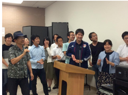
Japanese group singing at a karaoke party

In addition, as part of extracurricular activities, ice cream party, karaoke party, etc. were held and we were able to have a rich and a fun content in the first half of English training.