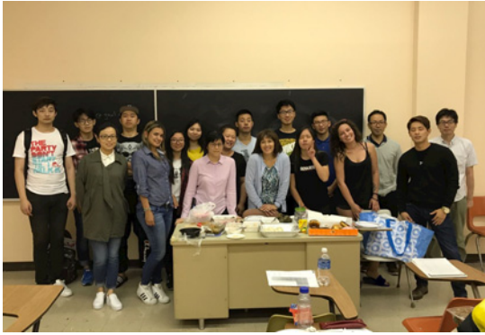
図1 ELI 授業のクラスメイト

豊橋技術科学大学 グローバル工学教育推進機構 国際教育センター 愛知県豊橋市天伯町雲雀ヶ丘 1-1 Tel:0532-81-5161 Mail:unireform@office.tut.ac.jp