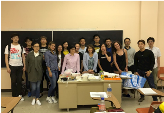
Fig.1 Classmates in my class.

I would like to study English more and learn about the education style of this country throughout this GFD program.