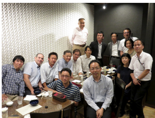
Farewell party for GFD member

In the first month, we learned pronunciation, how to build English for speaking, basic academic writing techniques and so on at intensive courses of ALC. Thereafter, we mainly learned how to organize for English classes and effective way of presentation at regular classes of ALC. Last year, exchange students came from QC in June, however, no one visit this year unfortunately.