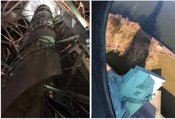
Inside of the Statue of Liberty (Left) Spiral stairs (Right) The date of the American Declaration of Independence on the book

The day has come on December 5, 2015. The Statue of Liberty seen from Liberty Island was really great. Then, I went inside her. The spiral stairs come to her head. There was a