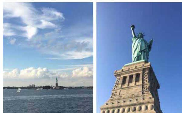
The statue of Liberty. (Left) Seen from the free ferry (8/23), (Right) Seen from Liberty island (12/5)

On that day, a subway route change made me get lost because it was unexpectedly changed. I was not aware that I had passed through Manhattan to Brooklyn. Even though I took the train going back to Manhattan again, the train did not stop at South Ferry Station, so I gave up taking the train and walked on the way to the station for about an hour. Finally, I got on the ferry. Miss Liberty from the free ferry was too small. I could not feel anything and never impressed by that. I was disappointed. At that precise moment, I thought that I could not go back to Japan without seeing the Statue of Liberty better, and I reserved the ticket to the crown of the Statue of Liberty. The number of the people who can go up to the crown in a day is set to a limit, and the ticket I got was available on Saturday, December 5, 2015. It was about three months later.