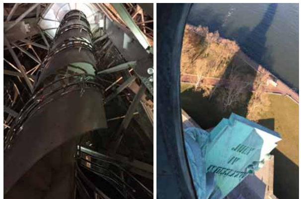
自由の女神内部。(左) 螺旋階段、(右) 王冠部分の窓から左手の独立宣言書を見下ろす