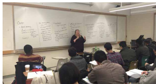
写真 1: Computer Architecture CS343

私は、単位取得科目として Computer Architecture (CS343/CS744) を受講しているのですが、同じ科目名の Computer Architecture (CS343)を聴講科目としても受講しています。受講科目を決める時には、同じ科目名なので講義内容も同じだと思っていたのですが、CS343/CS744 は、学部生と大学院生が同時に受講する講義となっており CS343 の授業よりも高度な内容となっていました。CS343 では、MIPS アーキテクチャの説明が中心となっており、英語での説明方法を学ぶ良い授業です(写真 1)。CS343/CS744 では、MIPS アーキテクチャの簡単な説明がありますが、ハザードやキャッシュアルゴリズムの説明が中心となっています。キャッシュアルゴリズム