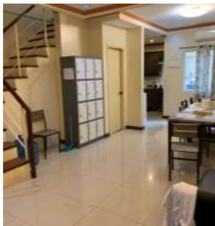
キッチン、リビング・ダイニング(1階)