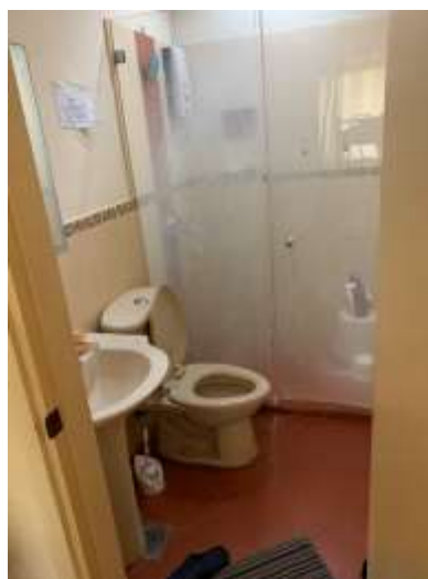
トイレ・シャワー(2階)