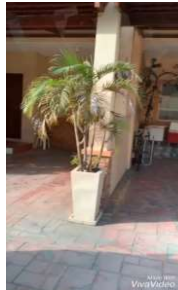
シェアハウス周辺