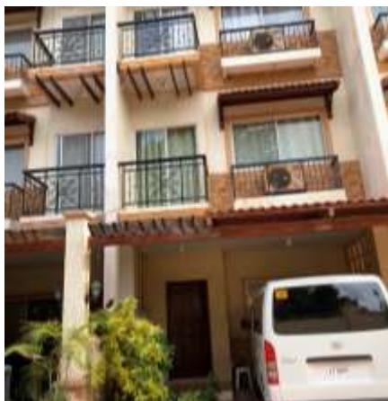
シェアハウスの外観(3階建て)