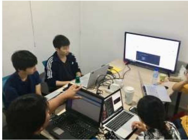
ITクラスの授業風景