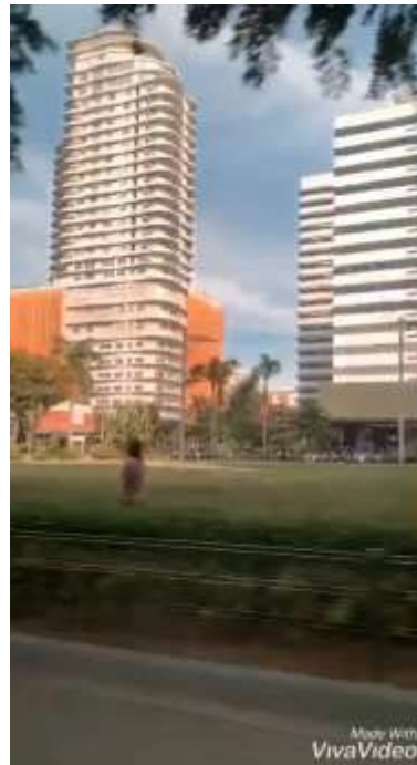
送迎バンから 撮影したITpark