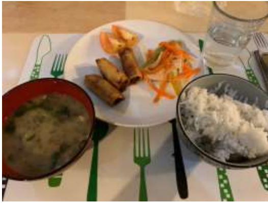
寮母さんが作ってくれる夕食