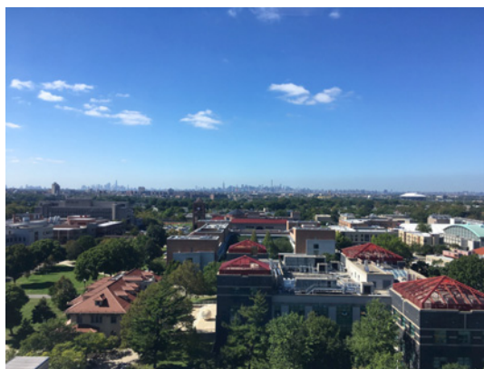
A prospect from the highest floor in Queens College to Manhattan Island, 5th October 2016

Every summer from the end of May to August is a summer term in QC. I heard that some QC students will study abroad or will take an internship at a company during the term. Ten students from the City University of New York (CUNY) 10 including QC also used the term so as to study at Toyohashi University of Technology, Japan, from the end of May to the middle of June. However, QC accepts students