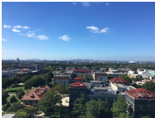
Queens College で一番高い建物から眺めた Manhattan 島, 平成 28 年 10 月 5 日撮影

なまはげ 1 で有名な秋田県から、東海道と海運で栄えた豊橋市を経て、Spider Man が生まれた Queens へやってきた。6月26日に成田空港を発ち、同じ日付の夕方に JFK 空港に到着。飛行機に搭乗中はなかなか眠れず、映画をたくさん見た: “Olympus Has Fallen”, “Youth - La Giovinezza”, “Fathers and Daughters”, “Kung Fu Panda 3”。映像のおかげで大体こんなことを言っているのだろうかと思いながらも結構楽しめた。それから3ヶ月が経った。